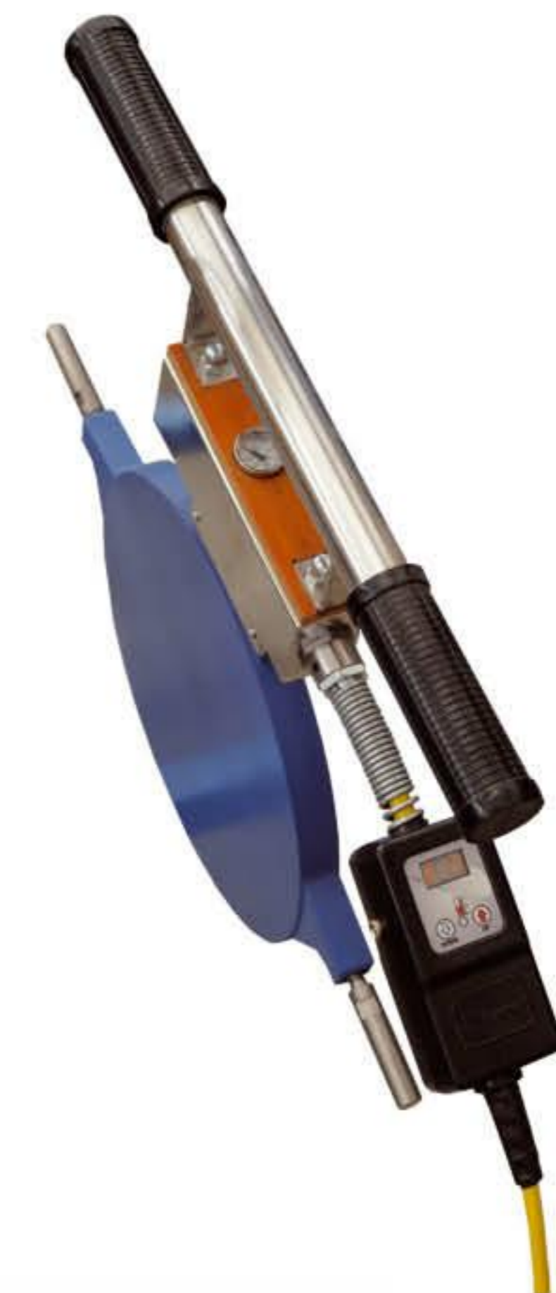
Нагреватель с Digital Dragon