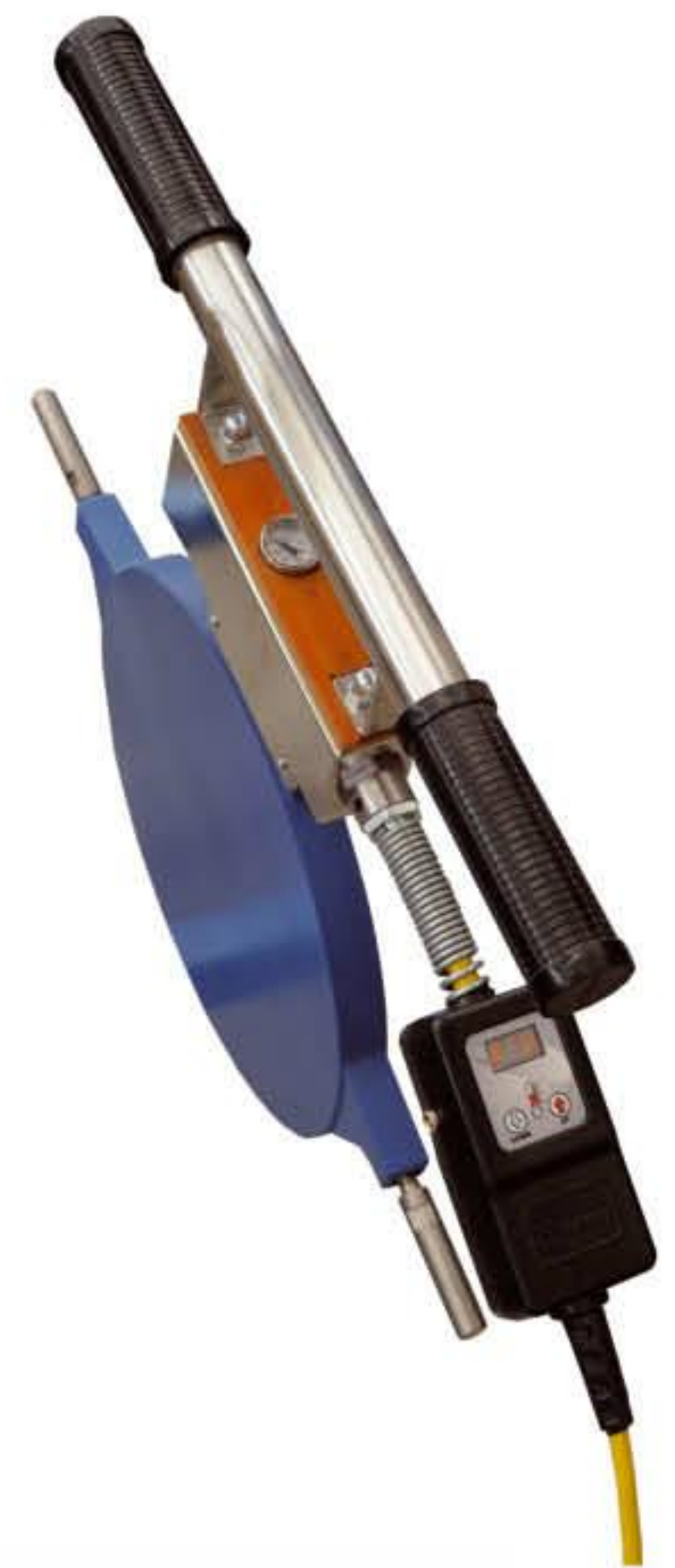
Нагреватель с Digital Dragon